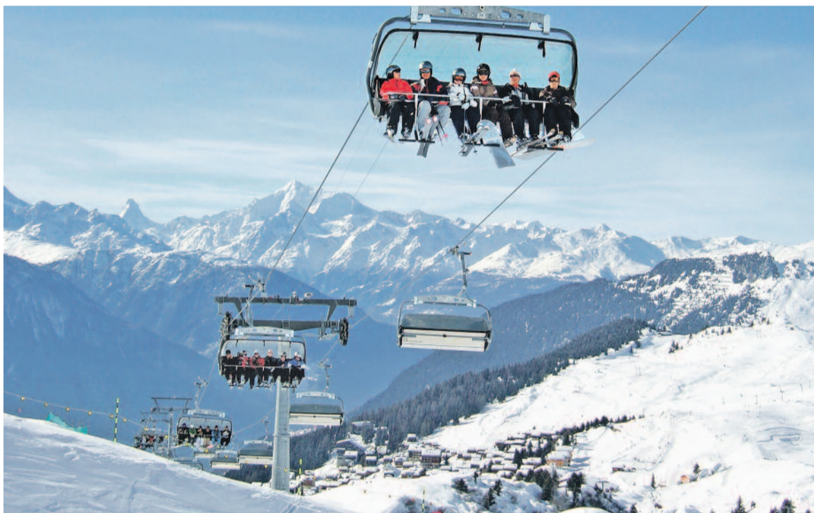
Höhere Tarife. Auf die kommende Wintersaison hin haben viele Stationen ihre Preise erhöht. Im Bild ist die Bettmeralp zu sehen.

Neun von sechzehn angefragten Oberwalliser Skistationen haben für diese Wintersaison Preiserhöhungen beschlossen. Vor allem die grösseren Skigebiete schlagen zwischen zwei und sieben Prozent auf. Jene mit den grössten Preissteigerungen begründen diese mit unlängst erfolgten oder auf die kommende Saison hin getätigten Investitionen und dem damit verbundenen Mehrwert für die Skifahrer. Neu auf diese Saison hin wurde ein spezieller Tarif für Jugendliche zwischen 16 und 20 Jahren eingeführt. Dieser bewegt sich zwischen zehn und fünfzehn Prozent unter den Erwachsenenpreisen. Mit der Lauchernalp, der Belalp, der Bettmeralp und der Fiescheralp haben nur wenige Stationen dieses Jahr kräftig in die Erneuerung ihrer Anlagen investiert. Für Experten ist dies ungenügend. Im Wallis bestehe ein Investitionsbedarf von rund einer Milliarde Franken. | Seite 3