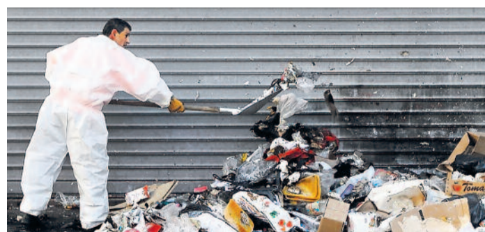
Dreck muss weg. In Marseille nahmen Mitarbeiter der Strassenreinigung ihre Arbeit wieder auf.

Die umstrittene Rentenreform in Frankreich hat am Dienstag ihre vorletzte Hürde genommen.