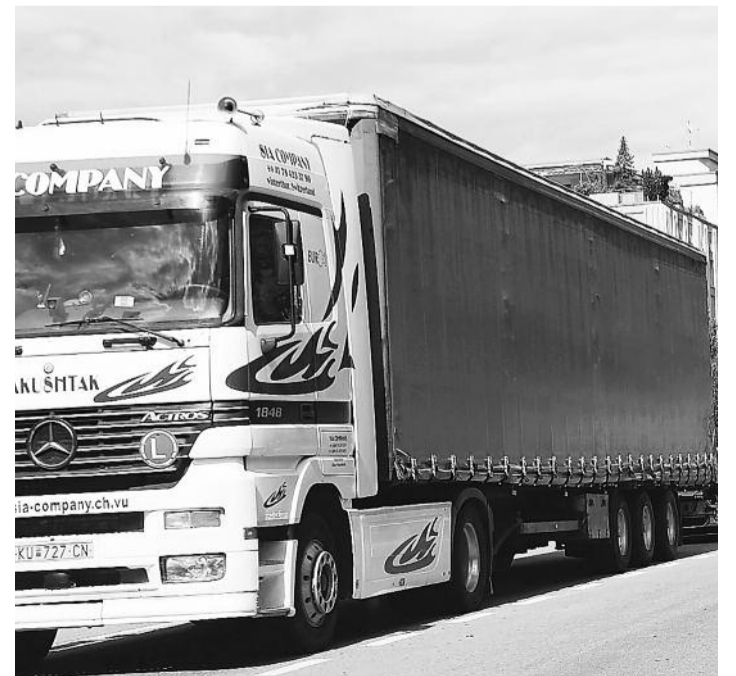
Bei einer Kontrolle der Kantonspolizei auf dem Flugplatz Turtmann wurden verschiedene Lastwagen kontrolliert – teilweise mit gravierenden Mängeln.

Gemäss ersten Ermittlungen muss angenommen werden, dass dieser Anhängerzug seit längerer Zeit in diesem technischen Zustand unterwegs war. Mehrmals wöchentlich wurden damit gleichartige Transporte zwischen der Westschweiz und Mailand über den Simplon durchgeführt. Wie die Polizei mitteilte, hat das Untersuchungsrichteramt Oberwallis gegen den Lenker und das Transportunternehmen ein Verfahren eingeleitet. | wb